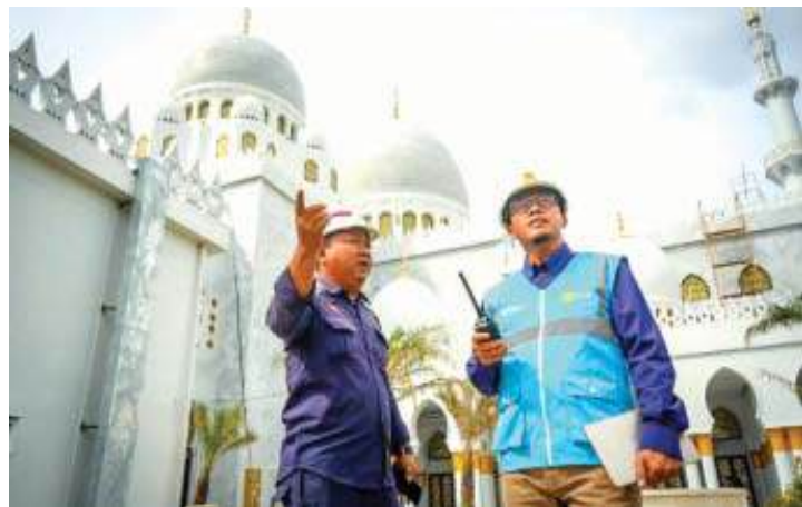
BERKAH - Pihak PT PLN (Persero) pada salah satu rumah ibadah. Kini, ada promo tambah daya untuk rumah ibadah melalui program Ramadhan Berkah 2023.