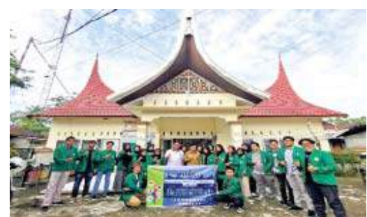
MENGABDI-Sejumlah mahasiswa Unand yang melaksanakan KKN-PPM tahun lalu sukses mengembangkan objek wisata bersama masyarakat Nagari Pasar Baru, Pessel.