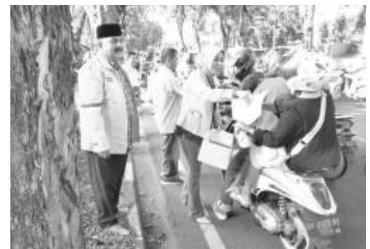
BAGI-BAGI TAKJIL - Penampakan proses bagi-bagi takjil oleh Partai Golkar Sumbar di kawasan Jl. Rasuna Said Padang.

Usai menjadi imam saat salat zuhur berjamaah, walikota menyerahkan dana hibah Rp10 juta kepada pengurus Mushalla Al-Mukminin. (405)