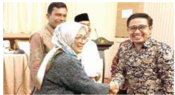
SELAMAT - Narasumber Bimtek memberi ucapan selamat pada salah seorang peserta.