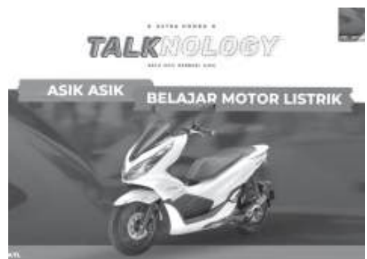
WEBINAR - Guru SMK mitra binaan AHM mengikuti webinar Astra Honda Talknology dengan tema Asik-Asik Belajar Motor Listrik beberapa waktu lalu. (*)

Pengetahuan yang didapatkan para guru diharapkan dapat diajarkan kepada para pelajar, sehingga para lulusan SMK dapat mengikuti perkembangan dunia usaha dan dunia industri di Indonesia. Perkembangan teknologi sepeda motor semakin pesat, termasuk motor listrik. Pemerintah juga sudah memberikan insentif untuk mendorong tumbuhnya pasar motor listrik. (109)