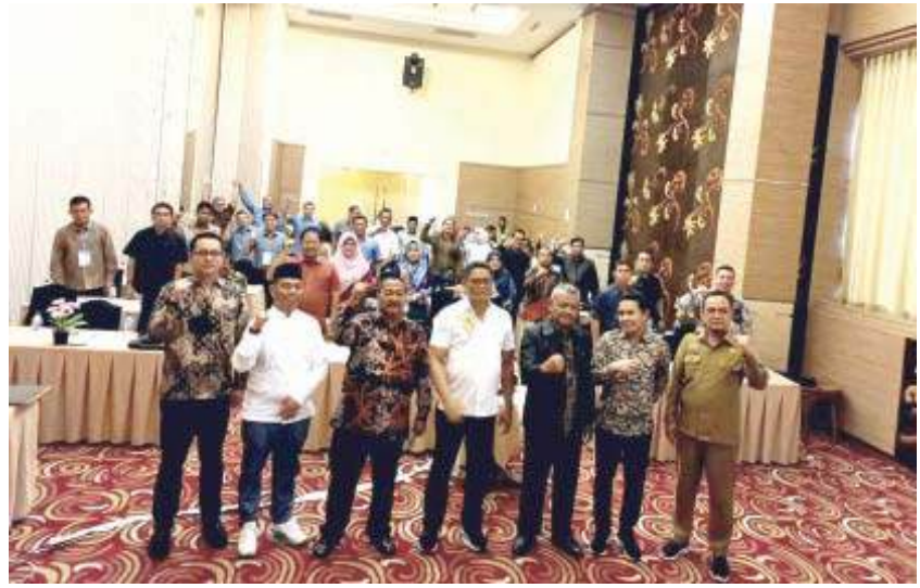
BERSAMA - Pimpinan DPRD dan anggota foto bersama usai pembukaan Bimtek.