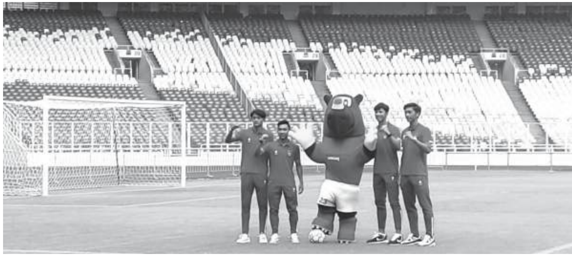
Pesepekbola Indonesia bersama maskot. Sepakbola Merah Putih tengah terancam.