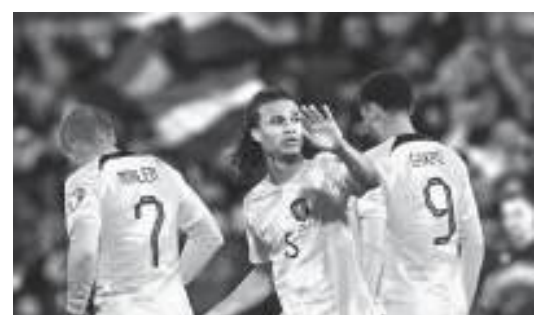
Bek Belanda Nathan Ake (tengah) melakukan selebrasi usai cetak gol ke gawang Gibraltar.

Tidak ada gol tambahan hingga pertandingan berakhir, Belanda menang dengan meyakinkan 3-0 atas Belanda. Demikian Antara. (*/102)