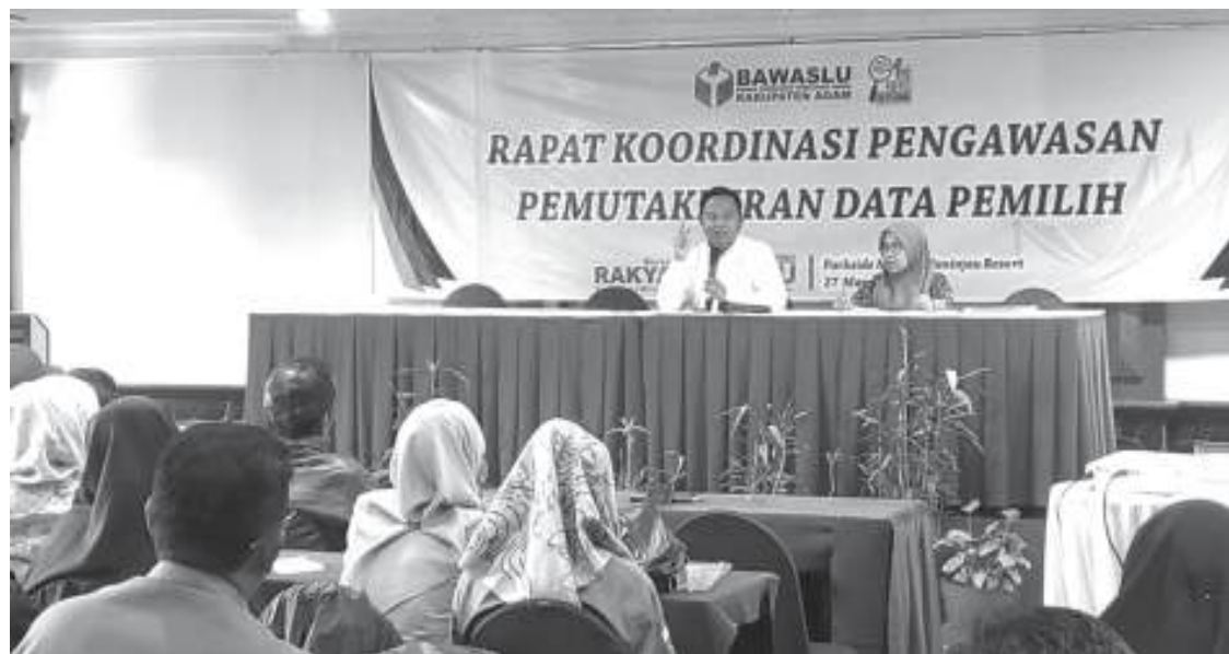
RAKOR | Bawaslu Agam menggelar Rakor Pengawasan Pemutakhiran Data Pemilih di Hotel Maninjau, Senin (27/3).