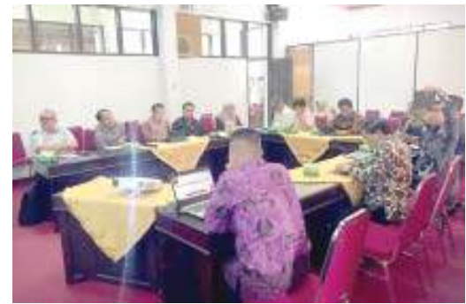
SUASANA-Suasana rakor terkait pelaksanaan KKN-PPM Terpadu.