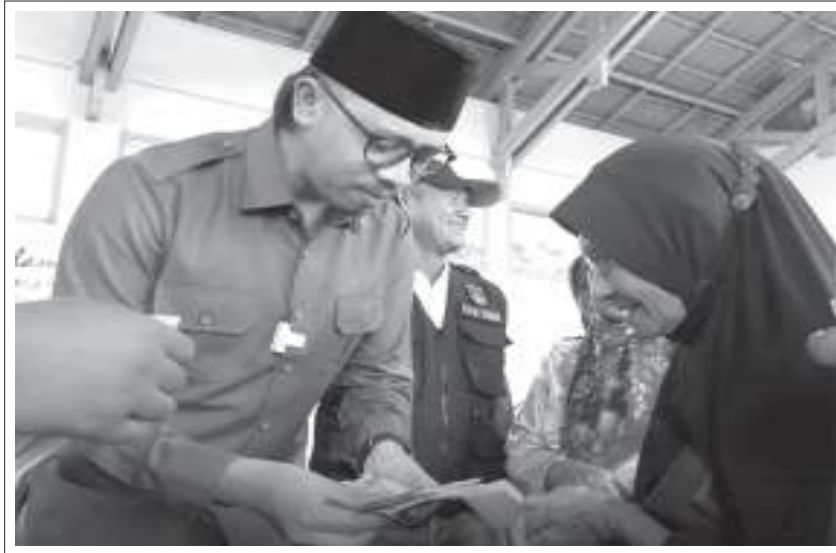
BANSOS Walikota Bukittinggi, Erman, Safar serahkan Bansos tahap I tahun 2023.