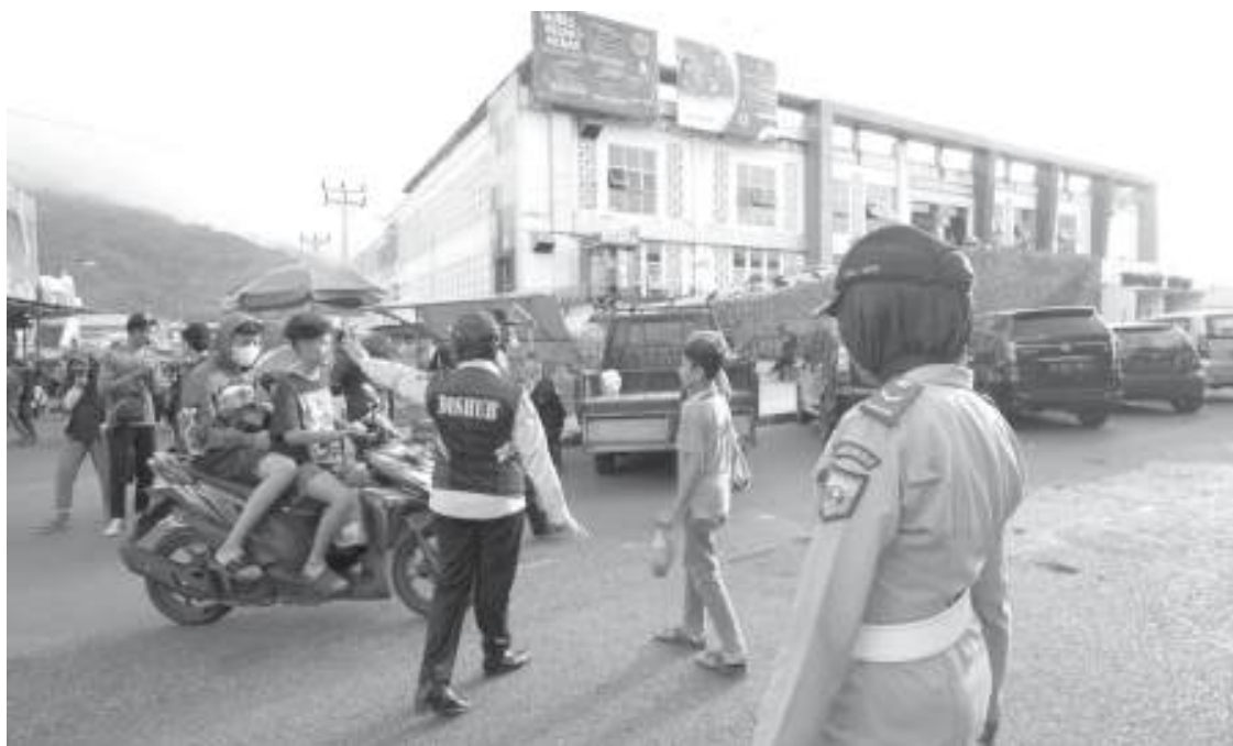
ATUR LALU LINTAS | Petugas Dishub tengah mengatur lalu lintas yang cukup padat di sejumlah kawasan pada sore hari Ramadhan.