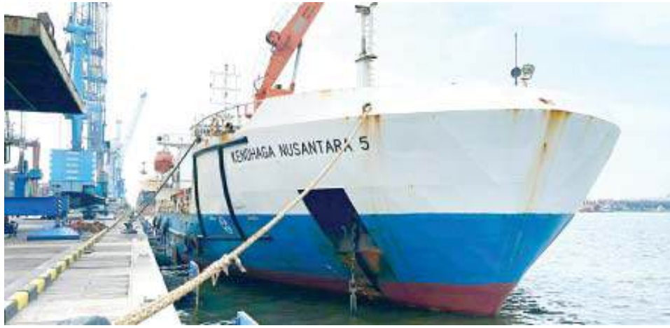
PEMUATAN BERAS Kapal KM Kendhaga 5 saat melakukan pemuatan beras sebanyak 600 ton di Pelabuhan Tg Perak Surabaya untuk mengatasi krisis (kelangkaan) beras di NTT.