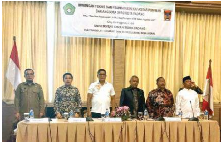
BIMTEK - Pimpinan DPRD Padang bersama narasumber dan Sekwan saat pembukaan Bimtek.